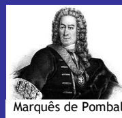
Marquês de Pombal